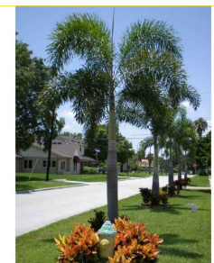
PALMEIRA RABO DE RAPOSA